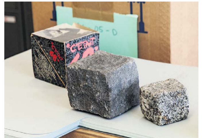
Unter den Pflastersteinen liegt vielleicht der Strand: Störmittel der sozialen Bewegungen.