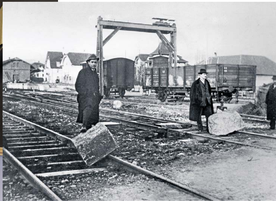
Hier kommt kein Zug durch: Streikposten beim Bahnhof Grenchen-Süd während des Landesstreiks am 13. November 1918.