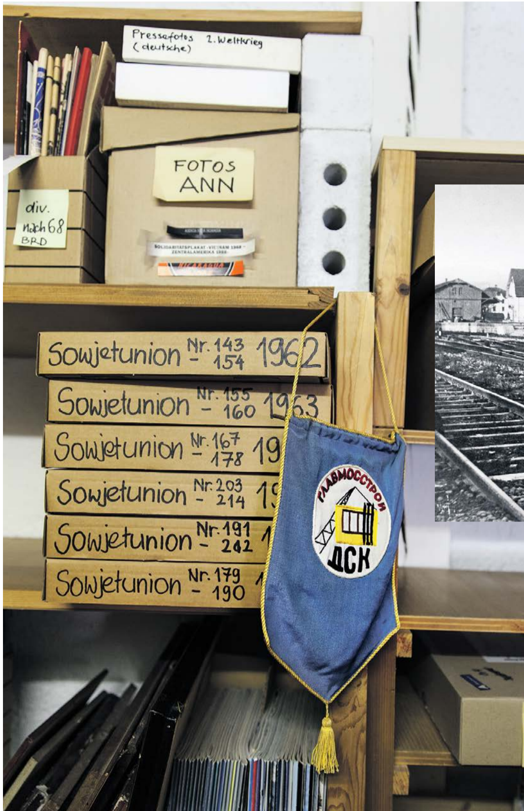
Fundgrube für Raumfahrtfans: Die Zeitschrift «Sowjetunion» aus den Jahren, als die Kosmonauten den Westen schockierten.