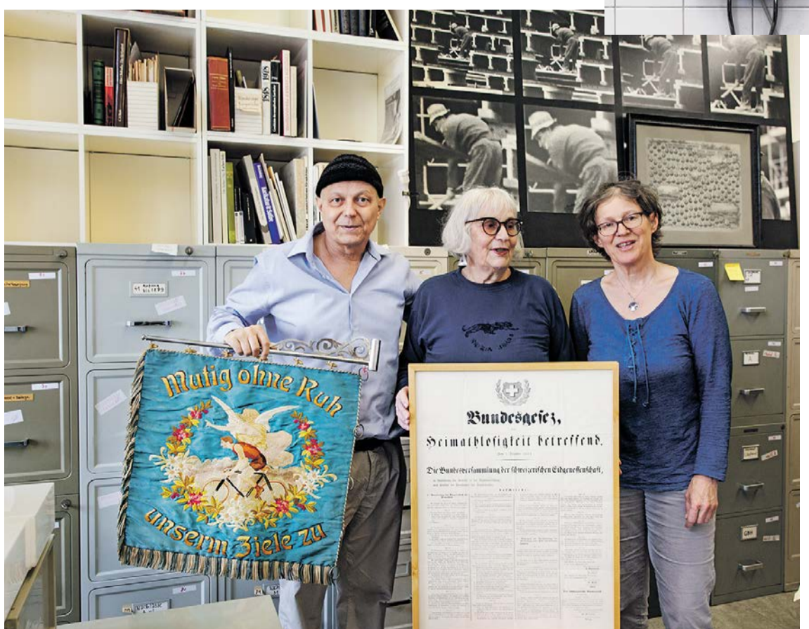
Genau bezeichnen, bitte: Das Einmaleins des Archivierens.