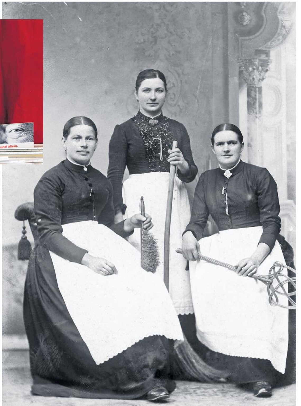
Mit Stolz und Berufswerkzeug: Vorstand des Wasch- und Putzfrauenvereins im Fotoatelier, Zürich 1890.

Sozialgeschichtsforschung. Ein wichtiges Fundstück war das Archiv des Arbeiterfotografenbunds, das Gretler in den achtziger Jahren übernehmen konnte. Dazu kamen private Nachlässe, etwa derjenige des Fotografen Adolf Felix Vogel. Aus verschiedensten Quellen versammelte er Bilder von bekannten und unbekanntem Fotografieren, bis hin zu gerahmten Aufnahmen aus Brockenhäusern; zudem stellte er hochwertige Abzüge aus Zeitschriften her, etwa aus der berühmten «Arbeiter-Illustrierten-Zeitung» der Weimarer Republik.